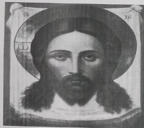
Икона «Спас Нерукотворный», 1658 год